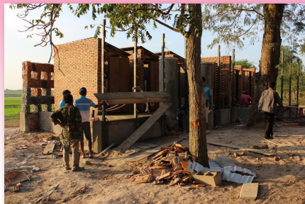
●在本會資助下，當地居民與香港學生義工們合力為當地學童建起衛生間