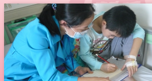
●本會資助醫院學校為住院學童提供病床邊一對一授課

由於醫院學校的理念與本會「護養群眾，關愛社會」的工作主題相符，且成效顯著，需求日增，故本會於2013年7月再捐款人民幣30萬元予佛山市紅十字會醫院學校，以支持開辦佛山市婦幼保健院分校、三水區人民醫院分校及南海區人民醫院分校，期望將此項有意義的免費教育服務帶給更多住院學生，讓病童們亦能學有所得，學有所成。