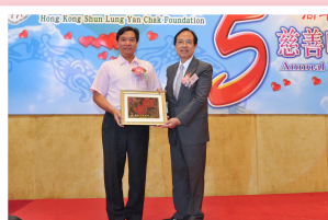
● 順德區政府向本會送贈香雲紗