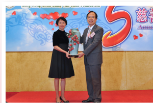
● 佛山市政府向本會送贈陶瓷滿堂紅