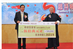
● 本會捐贈人民幣50萬元予順德慈善會

這是充滿愛與溫暖的夜晚，我們因仁愛而相聚，因施捨而喜樂，讓我們延續這份幸福，繼續把愛與溫暖送給更多有需要的人。希望今後各位亦能一如既往，與我會一同護養群眾，關愛社會，慈悲喜捨，福有攸歸。