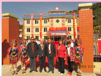
●「洛陽仁澤醫院」落成揭幕

本會2011年捐建之「洛陽仁澤醫院」已於2012年11月落成揭幕，該院門診綜合大樓建築面積1,088平方米，為人民提供包括門診、化驗、檢查、產科、住院等各項醫療服務。