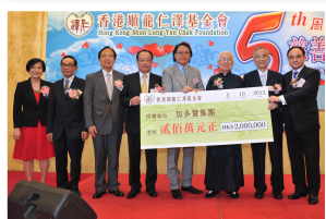
● 加多寶集團捐贈港幣200萬元