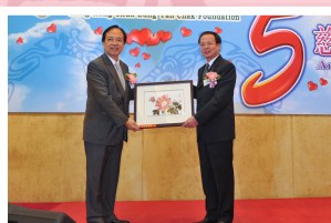
● 佛山市市委統戰部向本會送贈瓷畫