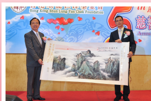
● 龍江鎮政府向本會贈畫