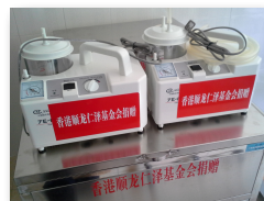
●本會捐贈之設備上均標記了「香港順龍仁澤基金會捐贈」