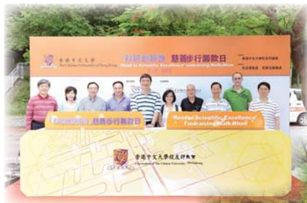
●「科研創新路」慈善步行籌款活動開幕禮

除醫藥資助外，本會亦支持醫學研究項目。繼去年贊助香港中文大學「同心植樹行」後，本年度又捐助港幣20萬元贊助香港中文大學「科研創新路」慈善步行籌款活動，支持中醫中藥研究所添置「高效液相色譜質譜聯用儀」，以提升中醫藥研究工作的水平與效率，推動中醫中藥現代化，期望能解決西方醫學束手無策的疾病，如退化、癌症、病毒感染、敏感與多種慢性病等。