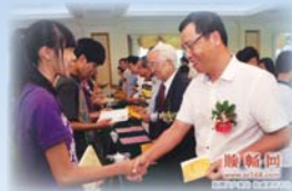
● 本會主席與受資助學生交換愛心