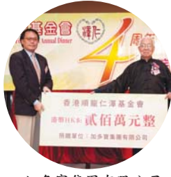
● 加多寶集團有限公司 捐贈港幣200萬元