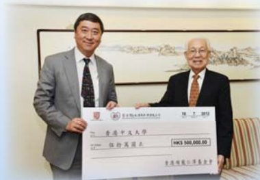
●本會向香港中文大學「I·CARE博群計劃」捐贈港幣50萬元

本會致力培育社會未來棟樑，不僅幫助孩子就學，更希望能讓受助孩子滿懷感恩之心回報和貢獻社會，並鼓勵即將投身社會的人才關懷社會，可以說是，本會不僅從事慈善工作，更將仁愛廣傳。本會相信，以愛喚醒愛，以生命影響生命，受惠的群眾將越來越廣，社會將越趨和諧美好。