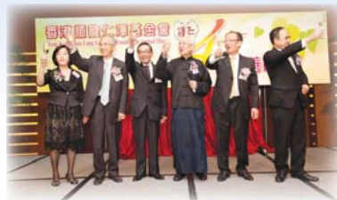
● 順龍仁澤基金會四周年晚宴祝酒儀式