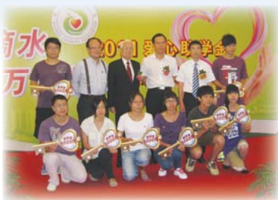
● 與接受資助的學生合影

除捐獻助學金外，本會更捐助人民幣45萬元協助雲南省騰沖縣中和鄉勐新村大壩完全小學重建校舍。該校於地震中嚴重損毀，已成D級危房，必須重建以確保師生安全。感謝中華精忠慈善基金推薦該項目及義務擔任工程監督，本會義不容辭，補助重建工程資金缺口，以改善現有學生及往後入讀之無數學生的學習環境。為表感謝，該校更名為「勐新村大壩仁澤完全小學」，以作紀念。