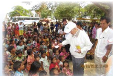
● 本會主席向柬埔寨孩童派發文具