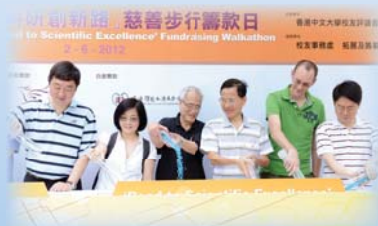
● 「科研創新路」啟動儀式