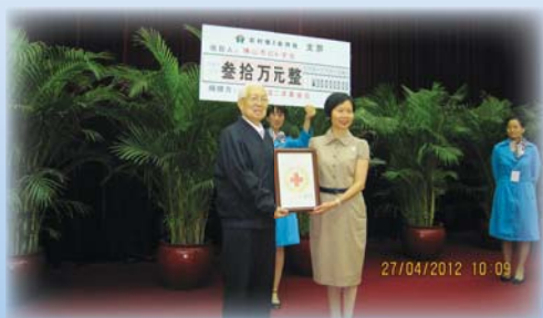
● 本會向佛山市紅十字會捐贈人民幣30萬元

本年度本會更開展一項新穎的慈善辦學模式，捐助人民幣30萬元以助佛山市紅十字會開辦第二所醫院學校。首間醫院學校於2010年9月1日成立，為因患病住院而無法正常上學的兒童提供個人化的免費教學服務及心理輔導，以助兒童在康復出院後能更好地順利咸接課程，重投學校生活。首間紅十字會醫院學校已運作了2年，成效顯著，不但教授傷病兒童課本上的知識，更讓受助家庭感受到愛的力量，有受助家長表示：「是醫院學校把愛心送給了孩子，送給了我們的家，我也要把這份愛送給更多的孩子，更多的家庭。」為了幫助更多住院兒童，為了以愛喚醒愛，本會捐款支持佛山市紅十字會於佛山市中醫院開辦第二所醫院學校，繼續發揚人道、博愛、奉獻的精神。